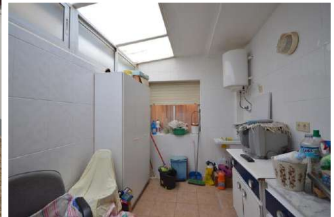
Cocina independiente con acceso a patio cerrado.