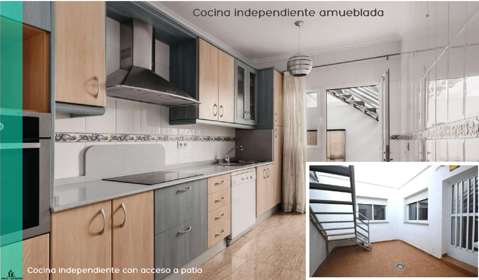
Cocina independiente con acceso a patio