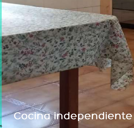
Cocina independiente con acceso a patio